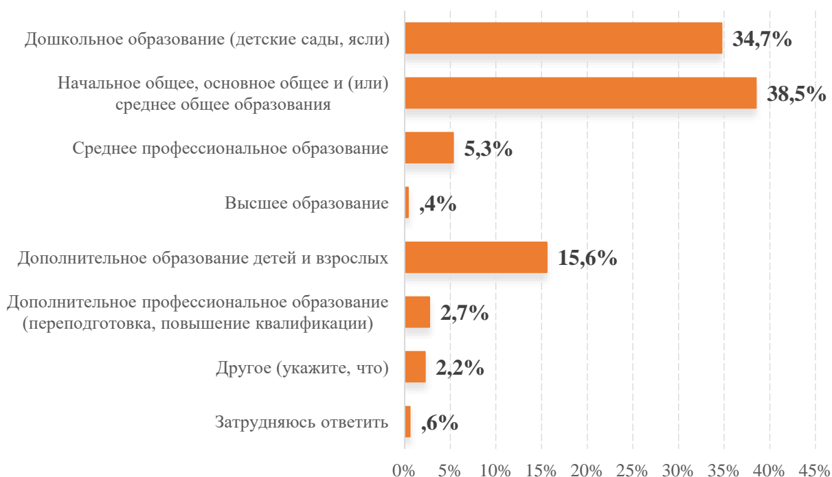
Рисунок 1. Распределение ответа на вопрос «Какой вид (виды) образовательной деятельности осуществляет Ваша организация/филиал/обособленное подразделение?» (открытый вопрос, % от ответивших, показаны квалификации, набравшие при ответе более 2% упоминаний)

38,5% организаций сферы образования, принявших участие в опросе, относятся к начальному общему, основному общему и (или) среднему общему образованию. Почти такая же доля в выборке мониторинга рынка труда относится к дошкольному образованию (детские сады, ясли) – 34,7%. 15,6% организаций-участников из сферы образования осуществляет образовательную деятельность по дополнительному образованию детей и взрослых.