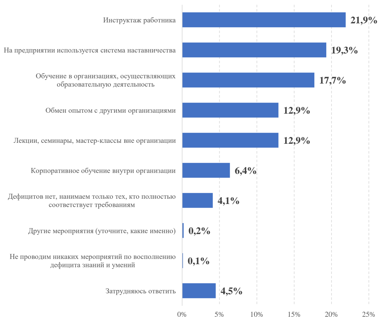
Рисунок 2. Ответ на вопрос: «Какие мероприятия по восполнению дефицита профессиональной подготовки/компетенций работников, принимаемых на работу, проводятся в Вашей организации?» (в % от ответивших организаций)

Для решения проблем с дефицитом квалифицированных кадров, работодатели сферы образования чаще всего обращаются в государственную службу занятости (36,3%), а также направляют своих работников на курсы повышения квалификаций (17,6%).